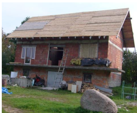
nowy obiekt – pierwszy z powstającego Ośrodka Integracji z Osobami Niepełnosprawnymi