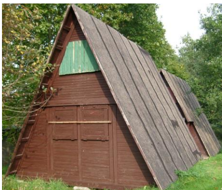
domki na polu namiotowym